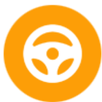
ชิ้นส่วนยานยนต์