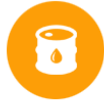
ผลิตภัณฑ์จากปิโตรเลียม