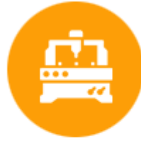
ผู้ผลิตเครื่องจักร