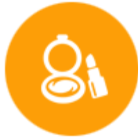
เครื่องสำอาง