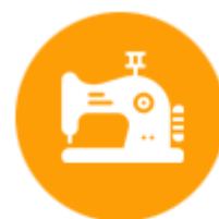
ผลิตภัณฑ์ศิลปะ และงานหัตถกรรม