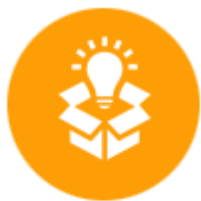
การผลิตสินค้าอุปโภค