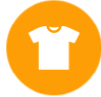
เครื่องแต่งกาย