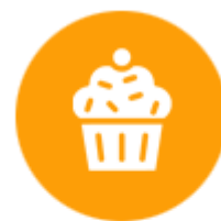
เบเกอรี่