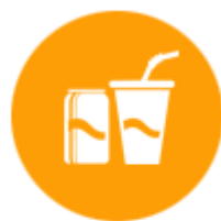
เครื่องดื่มสำเร็จรูป