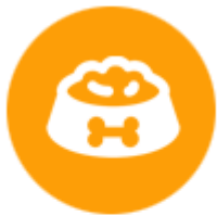
อาหารสัตว์