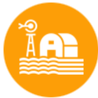
เกษตรกรรม