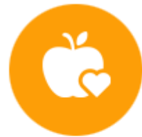
อาหารเพื่อสุขภาพ