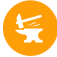
การแปรรูปชิ้นส่วนโลหะ