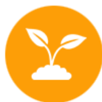
ผลิตภัณฑ์เกษตร แปรรูป