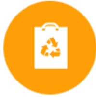
ผลิตภัณฑ์พลาสติก