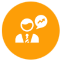
ผู้ให้บริการธุรกิจ อุตสาหกรรม