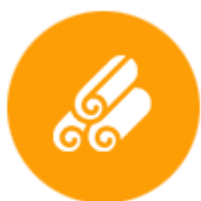
สิ่งทอและผลิตภัณฑ์ จากผ้า