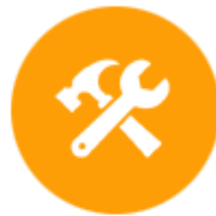
รับเหมาก่อสร้าง