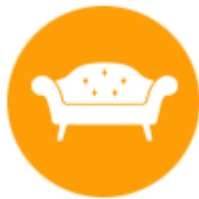
เฟอร์นิเจอร์