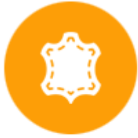
เครื่องหนัง