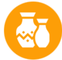
เครื่องปั้นดินเผา