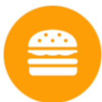
อาหารแปรรูป