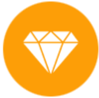
เครื่องประดับและอัญมณี