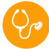
เครื่องมือทางการแพทย์