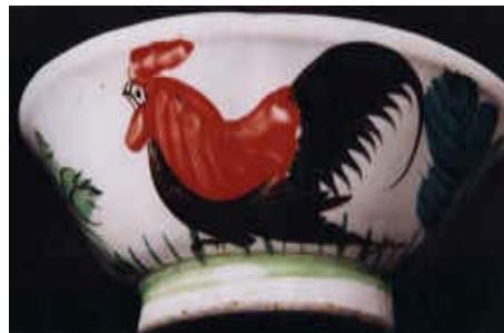
ไก่สีแดงสด