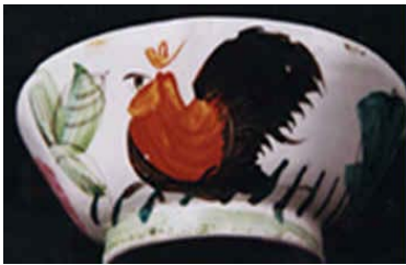
ไก่เตี้ย