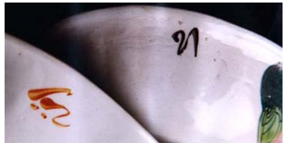
ลักษณะลายเซ็นต์