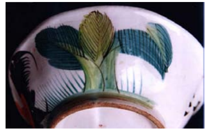
ภาพต้นกล้วย