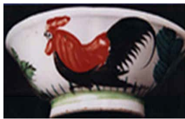
ไก่เดินเอียงย่าง