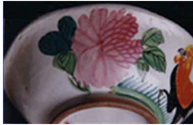
ภาพดอกโบตั๋น