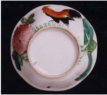
ลักษณะกันซาม